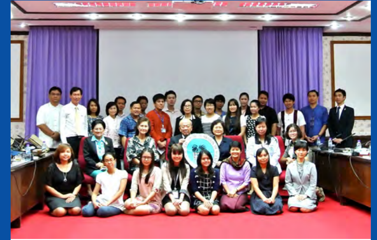
JSPS Guidance Seminar at Chiang Mai University