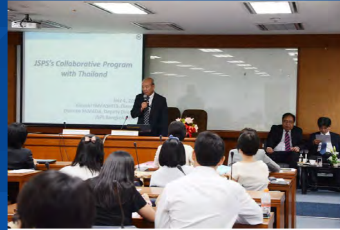
Director of JSPS Bangkok Office explains JSPS international programs at King Mongkut's Institute of Technology Ladkrabang

http://www.jsps.go.jp/english/e-ronpaku/