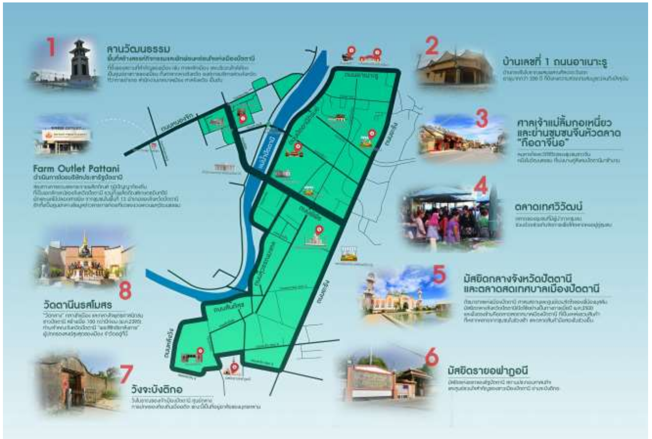
ภาพที่ 2 สถานที่จุดหมายในเส้นทางเขตพื้นที่ย่านเมืองเก่าปัตตานี

ความพร้อมของโครงการ: สามารถดำเนินการได้ทันที