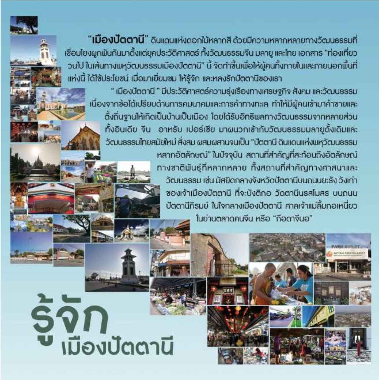
ภาพที่ 1 ข้อมูลเมืองเก่าปัตตานี เมืองพหุวัฒนธรรม

ด้วยมรดกทางศิลปะและวัฒนธรรมที่สะท้อนออกมาในสิ่งที่จับต้องได้และจับต้องไม่ได้ เช่น อาหารของกลุ่มวัฒนธรรมมลายู จีน ไทย อาคารและสถาปัตยกรรมพื้นถิ่นทั้งที่เป็นเรือนพักอาศัย อาคารพาณิชย์ และวังเก่า เครื่องแต่งกาย และสิ่งทอประจำพื้นถิ่นที่มีอัตลักษณ์ทั้งในด้านลวดลายและเทคนิควิธีการผลิต ดนตรีและศิลปะการแสดง วรรณกรรม ตำนาน และเรื่องเล่าที่สะท้อนประวัติศาสตร์ความเป็นมาของแต่ละกลุ่มวัฒนธรรม เป็นสิ่งที่ทรงคุณค่าทั้งทางด้านจิตใจและคุณค่าในฐานะมรดกทางประวัติศาสตร์ที่สำคัญ ทั้งยังสะท้อนแสดงให้เห็นถึงการดำรงอยู่ร่วมกันของผู้คนที่มีความหลากหลายในปัตตานีมาตั้งแต่ครั้งอดีต นับเป็นต้นทุนสำคัญในการส่งเสริมธุรกิจการท่องเที่ยวเชิงสร้างสรรค์และวัฒนธรรม ประกอบกับจังหวัดปัตตานีมีแหล่งท่องเที่ยวและกิจกรรมการท่องเที่ยวที่หลากหลาย สามารถรองรับและให้บริการนักท่องเที่ยวได้ตลอดทั้งปี นำไปสู่การสร้างรายได้จากการท่องเที่ยวในภาพรวม และส่งผลต่อการเชื่อมโยงทางการท่องเที่ยวในพื้นที่สามจังหวัดชายแดนภาคใต้